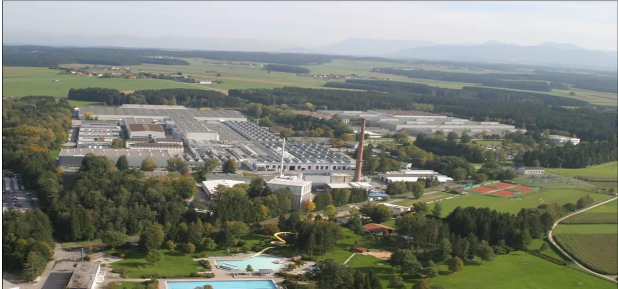
Standort Factory Cooking Traunreut (FCGT) der BSH Hausgeräte GmbH.